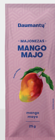
Majonezas Mango Majo